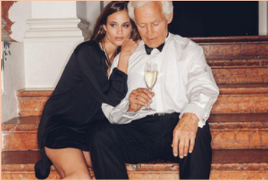
MY SUGAR DADDY MARRY ME