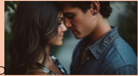
I REVERSE MY GAY BEST FRIEND