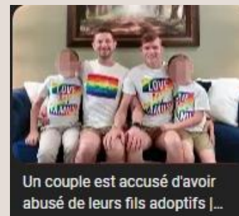
Couple gay ayant abusé de leurs fils adoptifs.

Maintenant qu'ils ont pris vos hommes, ils font désormais main basse sur vos enfants. Puisqu'il leur faut toujours un dévidoir à sperme, après les objets inanimés tel que les poupées gonflables puis siliconés, les animaux et pour finir les enfants et les bébés. L'idée était d'abord de coucher avec tout le monde, permettre à chacun de se mélanger avec qui il souhaitait avant d'imposer leur travers sur des individus plus faibles et sans défenses. Ce n'était pas le droit de s'aimer librement qu'il réclamait mais celui d'étendre leur avidité.